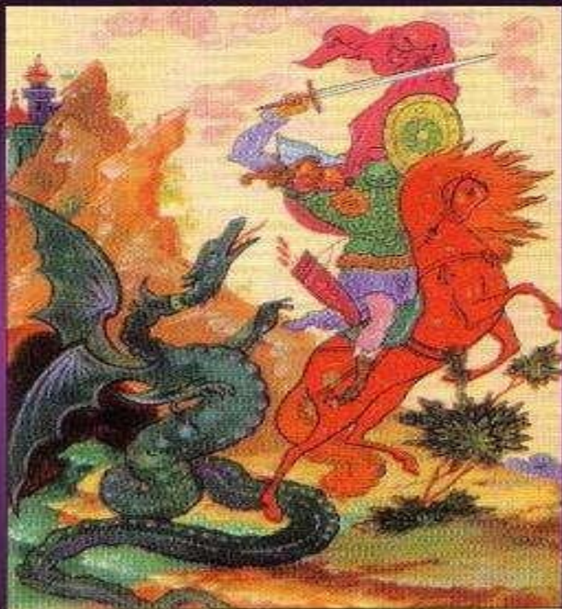
В.Большаков (Палех). Добрыня Никитич и Змей