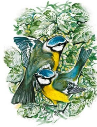
Иллюстрации Татьяны Капустиной